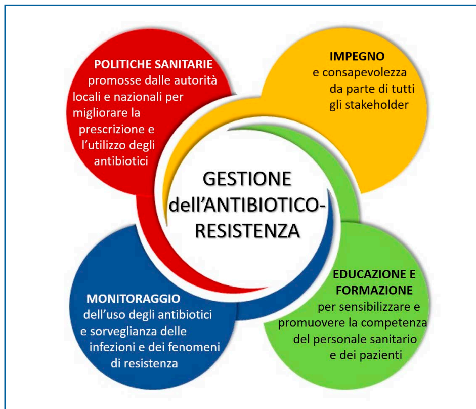
Figura 3 Principali linee di indirizzo per le strategie di controllo e gestione dell'antibiotico-resistenza.

sul consumo di antibiotici e sull'AMR è infatti quello di fornire informazioni, approfondimenti e strumenti necessari ad attuare interventi di contenimento della stessa a livello locale, nazionale e globale [42]. I parametri che devono essere necessariamente analizzati riguardano tre campi: il consumo di antibiotici in ambito umano e zootecnico, i tassi di resistenza per varie combinazioni farmaco-batterio e il loro impatto sulla salute, e la biologia molecolare, fondamentale per definire le basi biologiche della resistenza per mezzo della caratterizzazione delle tipologie di batteri resistenti e delle ragioni genetiche della loro resistenza [43]. Un organo estremamente importante per la sorveglianza dell'antibiotico-resistenza a livello globale è il Global Antimicrobial Resistance Surveillance System (GLASS) gestito dall'OMS. Lo scopo principale è di sostenere la sorveglianza e la ricerca globali al fine di rafforzare le evidenze sull'AMR e supportare quindi il processo decisionale guidando le azioni nazionali, regionali e globali. Gli obiettivi del GLASS comprendono la promozione di sistemi di sorveglianza nazionali e standard globali armonizzati, la stima della portata e dell'onere della resistenza antimicrobica a livello globale, l'analisi e l'aggiornamento regolare dei dati mondiali, la rilevazione di focolai di resistenza emergenti, l'attuazione di programmi mirati di prevenzione e controllo e infine la valutazione dell'impatto degli interventi [44-46].